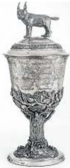
Der so genannte „Luchspokal“ aus dem Jahr 1818 ist eine Leihgabe aus Privatbesitz in der Ausstellung „Schatzkammer Harz“.

Als schließlich 1818 im Forst bei Seesen die Treibjagd zu einem Ende kam und der „reitende Förster“