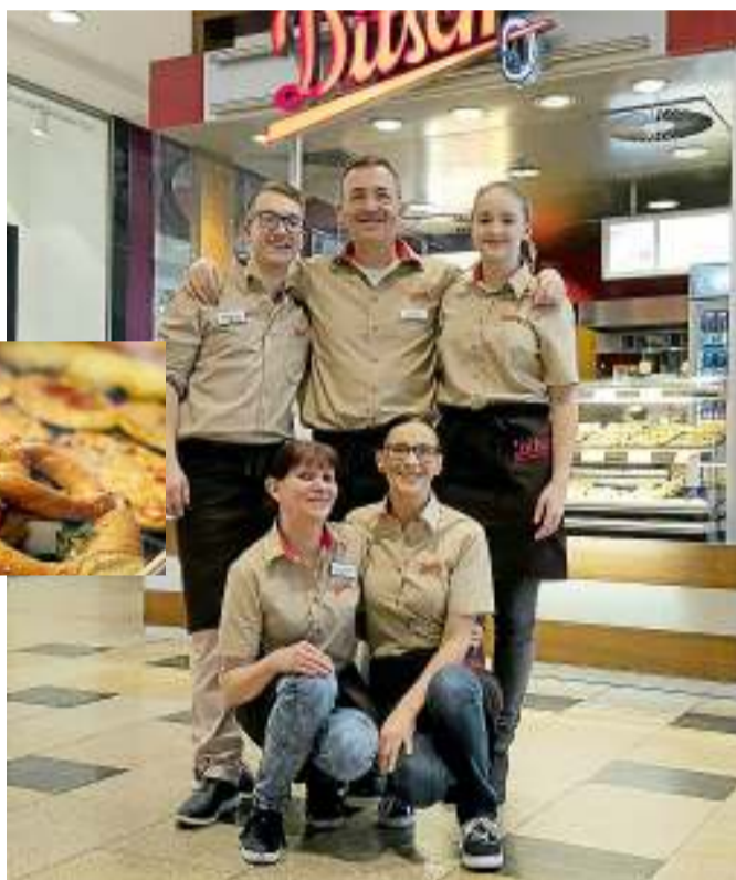
Das neue Team von Ditsch im Basement der Schloss-Arkaden.

Brezel-Geschmack bringen. Bereits an diesem Wochenende, Freitag und Samstag, sind sie in der Mall unterwegs und verteilen kleine Appetizer an die Kunden. Im Januar und Februar gilt bei Vorlage des Coupons auf der nächsten Seite zudem „2 für 1“ – zwei Pizzen zum Preis von einer. Profitieren Sie außerdem vom Sparmenü mit einem Getränk zum Snack.