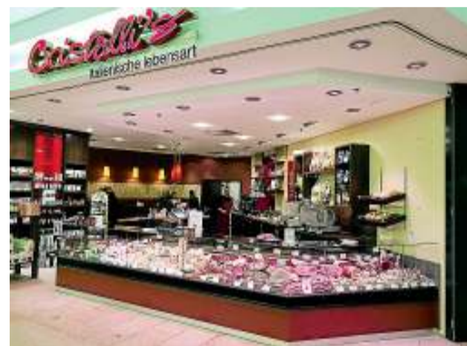
Das Team von Cristalli's präsentiert seine italienischen Köstlichkeiten ab sofort in einer neuen Frischetheke.

Jeden Tag wird jeder einzelne Taleggio per Hand mit Salzwasser gebürstet und in frische Baumwolltücher in Tannenholzregalen gelagert. Dadurch entsteht ein Produkt