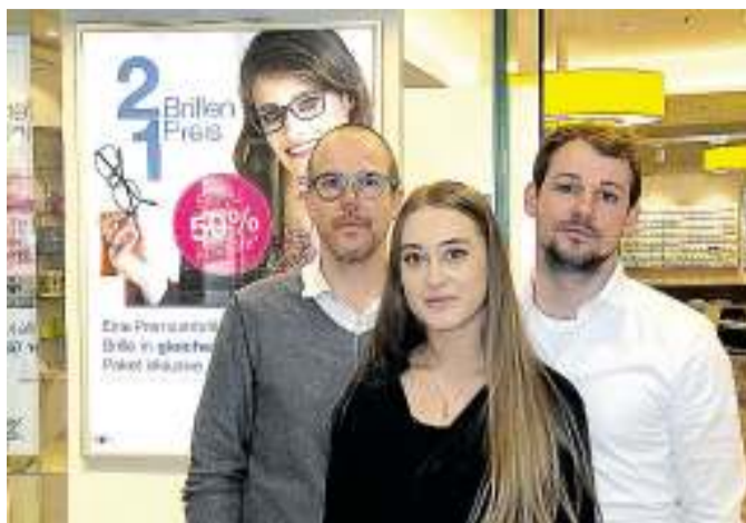
Das Team von becker+flöge in den Schloss-Arkaden bietet derzeit wieder die beliebte „2 Brillen, 1 Preis“-Aktion an.

Das Team von becker+flöge verwendet ausschließlich Gläser von führenden Markenherstellern wie HOYA und ZEISS – selbstver-