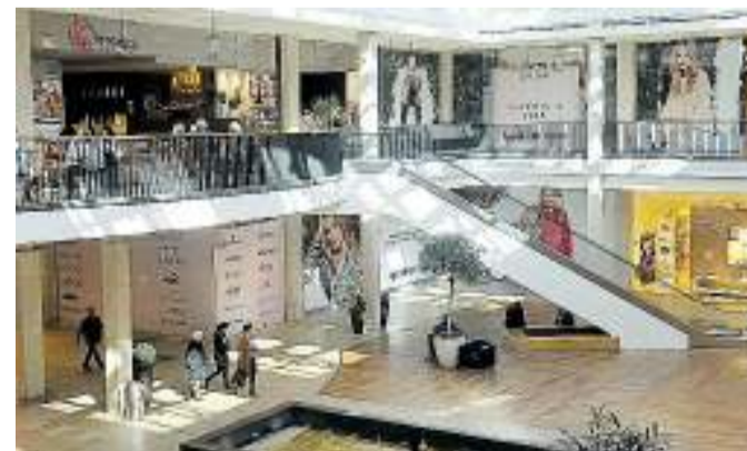
Auf der ehemaligen Pohland-Fläche in der Schlosshalle eröffnet am 12. April das Modegeschäft „AppelrathCüpper“.

Feminin, anspruchsvoll, persönlich und leidenschaftlich – diese Werte, die sich das Unternehmen auf die Fahnen geschrieben hat, werden künftig auch in der Löwenstadt wehen. Seit über 130 Jahren begeistert Appelrath-Cüpper seine Kundinnen mit seiner persönlichen Einkaufsatmosphäre, seinem anspruchsvollen Sortiment