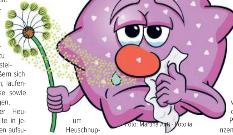
um Heuschnupfen handelt – das auslösende Allergen zu finden, kann oftmals jedoch einer regelrechten Detektivarbeit gleichkommen. Um welche Pflanzen es sich handelt, kann ein Blick in den Pollenflugkalender helfen. Er zeigt, zu welcher Zeit welche Pflanzen ihre Pollen freisetzen. Dann sollte mit dem Arzt besprochen werden, wie die weitere Vorgehensweise aussehen wird, um

Weitere Tipps für Allergiegelaplagte hat das Team der Arkaden-Apothek in den Schloss-Arkaden.