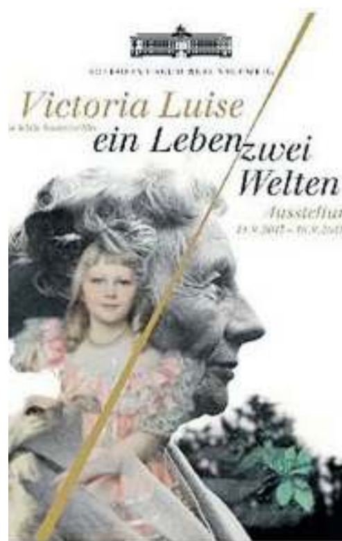
Victoria Luise an ihrem 85. Geburtstag mit ihrer Tochter Friederike von Griechenland. Ihr Hut ist derzeit zusammen mit zahlreichen weiteren Exponaten zur Mode in der Ausstellung „Victoria Luise – Ein Leben, zwei Welten“ im Schlossmuseum zu sehen.

Die Hüte Victoria Luises veranschaulichen den Wandel der Mode im Verlauf des 20. Jahrhunderts und erinnern an Ereignisse aus ihrem Leben sowie aus der Geschichte Braunschweigs. Zahlreiche Exemplare aus ihrem Besitz sind derzeit in der Sonderausstellung „Victoria Luise – Ein Leben, zwei Welten“ zu sehen, die außerdem Mode und Accessoires zeigt und durch weitere persönliche Gegenstände Einblick in das Leben der letzten braunschweigischen Herzogin gibt.