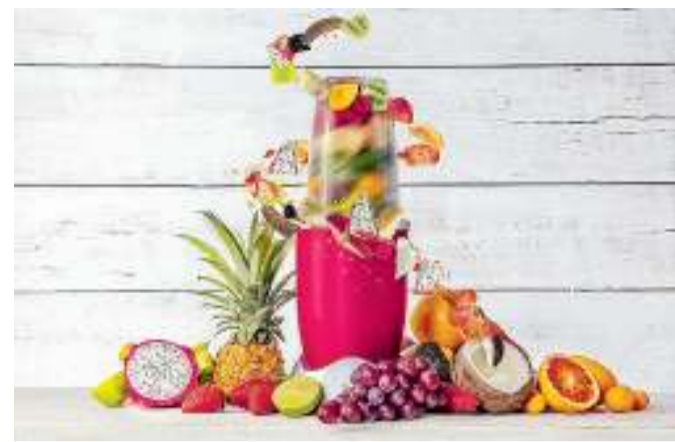
Bei Atlantik's Fröchtchen werden die Früchte ganz frisch im Mixer zu Säfte und Smoothies zubereitet.

Um die Sonne anzulocken empfehlen die Frische-Experten ganz besonders exotische Früchte. Und Köstlichkeiten wie Papayas, Maracujas und Mangos zum Beispiel mag doch jeder gerne. Sie sorgen für den absoluten Vitaminkick! In frischen Säften können sie zudem köstlich kombiniert werden. Die Früchte wandern dabei direkt vor den Augen der Kunden in den Mixer und werden ganz frisch zubereitet. Für Leckermäulchen, die es eher süßer mögen, empfiehlt das Team die Kombinationen Papaya, Erdbeer, Orange oder Mango, Pa-