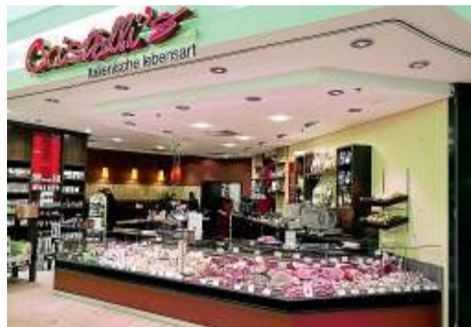
Für einen leichten, mediterranen Snack für zwischendurch gibt es eine große Auswahl in Cristalli's Antipastitheke.

Dazu reicht ein frisches Weißbrot und der Genuss ist perfekt!