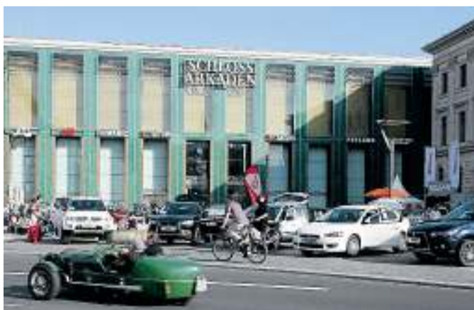
Am ersten Maiwochenende heißt es wieder „modeautofrühling“ in Braunschweig.

Moderne Neuwagen, flotte Elektroautos und schicke Oldtimer – beim „modeautofrühling“ am ersten Maiwochenende präsentieren über 20 Autoaussteller neue Modelle und alte Schmuckstücke in der Innenstadt. Dabei lohnt sich der Innenstadtbesuch nicht nur für Autofans, sondern auch für Modeliebhaberinnen und -liebhaber. Mit unterhaltsamer Musik und Aktionen für Kinder wird das Wochenende zudem zum Erlebnis für die ganze Familie, wenn die Maisonette in Eisdielen und Cafés unter freiem Himmel lockt und die dekorierte Innenstadt zum Einkaufsummel lädt.